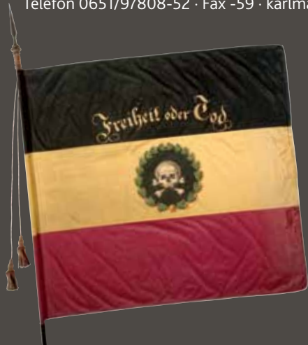
Fahne der „Freiwilligen Compagnie“ der Reutlinger Freischärler, Mai 1848.

Buchungen der Programme über: Trier Tourismus und Marketing GmbH Telefon 0651/97808-52 · Fax -59 · karlmarx2018@trier-info.de