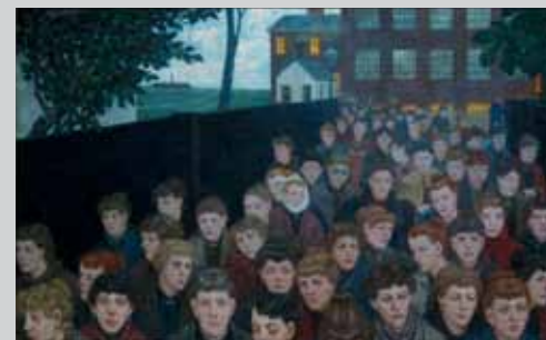
Hans Baluschek, Arbeiterinnen (Proletarierinnen), 1900. Stiftung Stadtmuseum, Berlin

Dauer: ca. 90 Minuten. Kostenbeitrag: Eintritt zzgl. 5,- € Führungsgebühr. Max. 25 Pers., Vorverkauf über Ticket Regional, Tel. 0651/97 90 777.