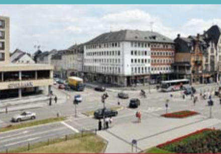
Porta-Nigra-Platz, um 1920 und 2011. Fotos Stadtarchiv Trier, M. Bätz; Rheinisches Landesmuseum Trier, Th. Zühmer.

Zur Ausstellung ist ein spezielles Programm für Schulklassen von Kl. 6 bis 10 buchbar. Weitere Informationen unter www.landmuseum-trier.de .