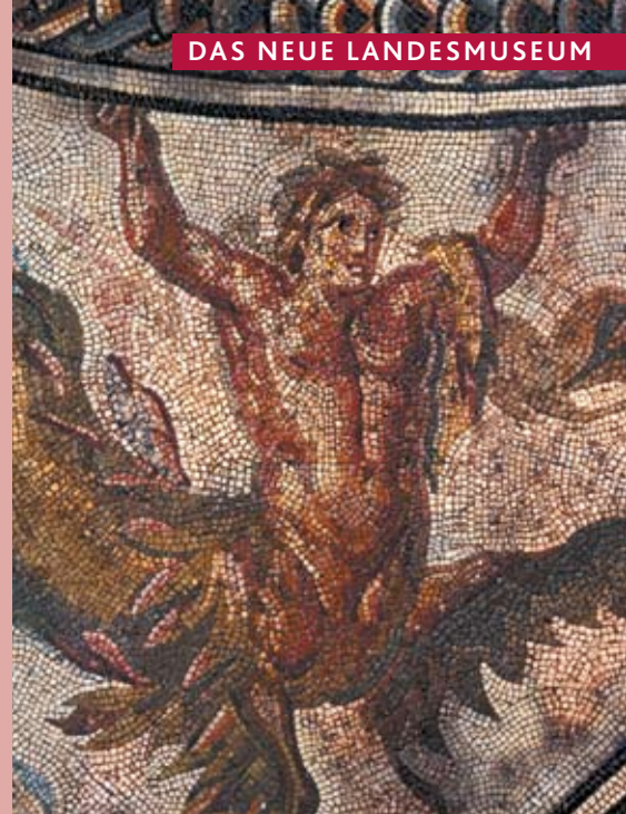
DAS NEUE LANDESMUSEUM

Die Geschichte von der Steinzeit zur römischen Metropole, vom Mittelalter zum Barock findet auf 3 500 modern und abwechslungsreich inszenierten Quadratmetern Platz. Eine Hörführung ist im Eintrittspreis enthalten, Medienstationen erläutern die Methoden der Archäologie.